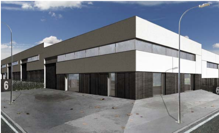
LOCALS i NAUS Roques Planes [Torredembarra]